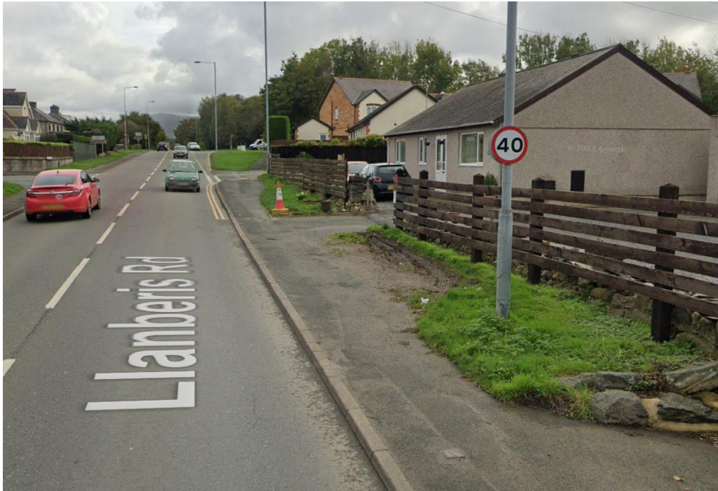
Lluniau o Google Street view Mis Hydref 2021