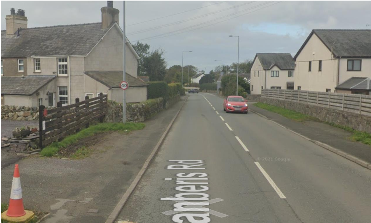
Lluniau o Google Street view Mis Hydref 2021